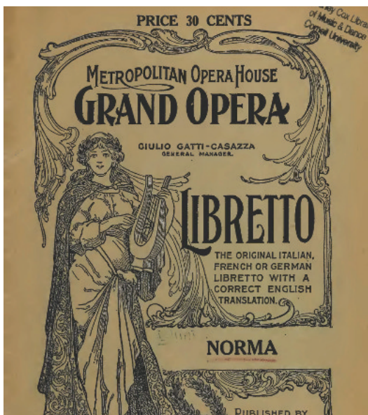
Libretto to the opera Norma by Vincenzo Bellini and Felice Romani 由贝里尼(Vincenzo Bellini, 1801-1835)与罗马尼(Felice Romani, 1788-1865)所创作的歌剧《诺玛》脚本 (US-I ML50.B44 N8 1900)